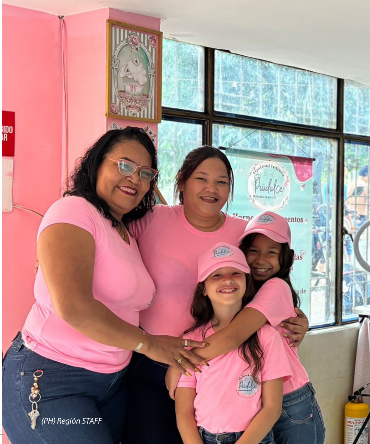
(PH) Región STAFF