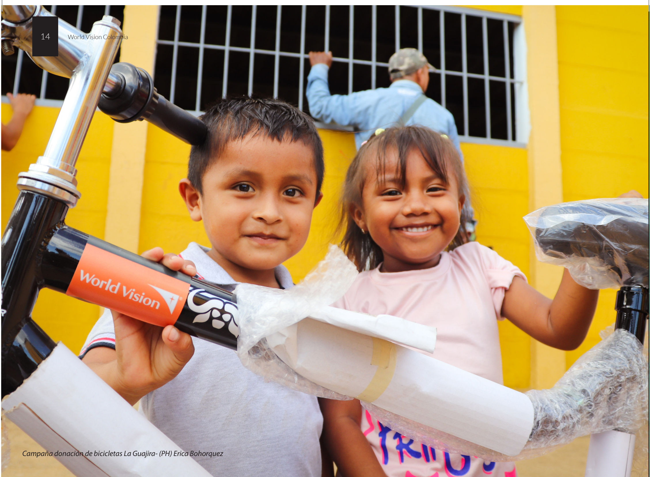
Campana donación de bicicletas La Guajira