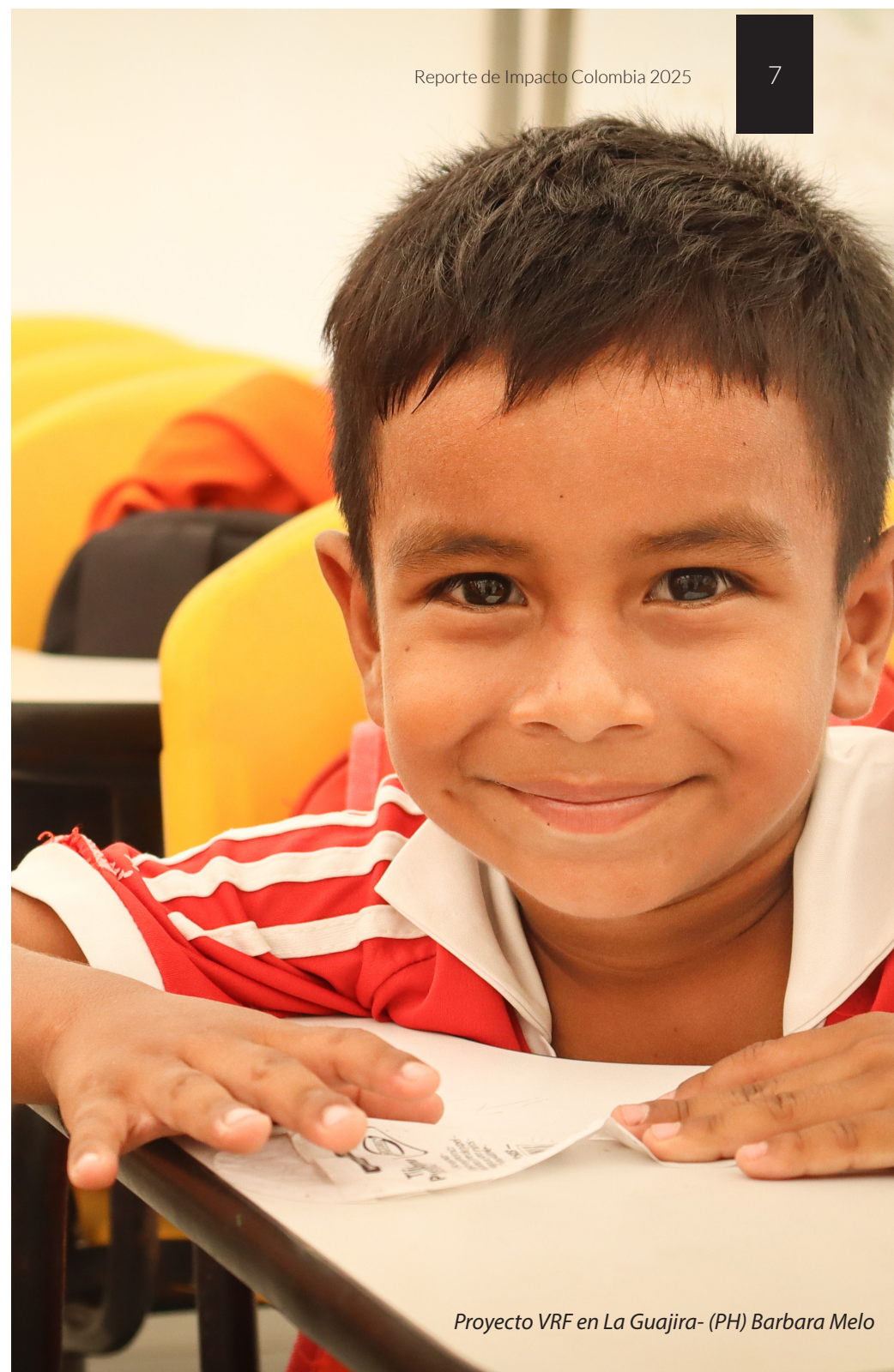
Proyecto VRF en La Guajira

En cuanto a la crisis de movilidad humana en la frontera, proceso que se ha agudizado para las familias que han retornado desde Panamá hacia Colombia tras atravesar ruta del Darién, las familias se han encontrado con una respuesta limitada para cubrir sus necesidades básicas, lo que ha disminuido el acceso a salud, alimentación y alojamiento seguro. A esta situación se suma la revictimización de algunas familias que han sufrido desplazamientos ocasionados por enfrentamientos entre grupos armados y economías ilícitas en los territorios donde habitan y al ser extranjeros se sienten más vulnerables. Esta combinación de factores evidencia la ausencia de mecanismos efectivos de protección y atención integral para la población migrante.